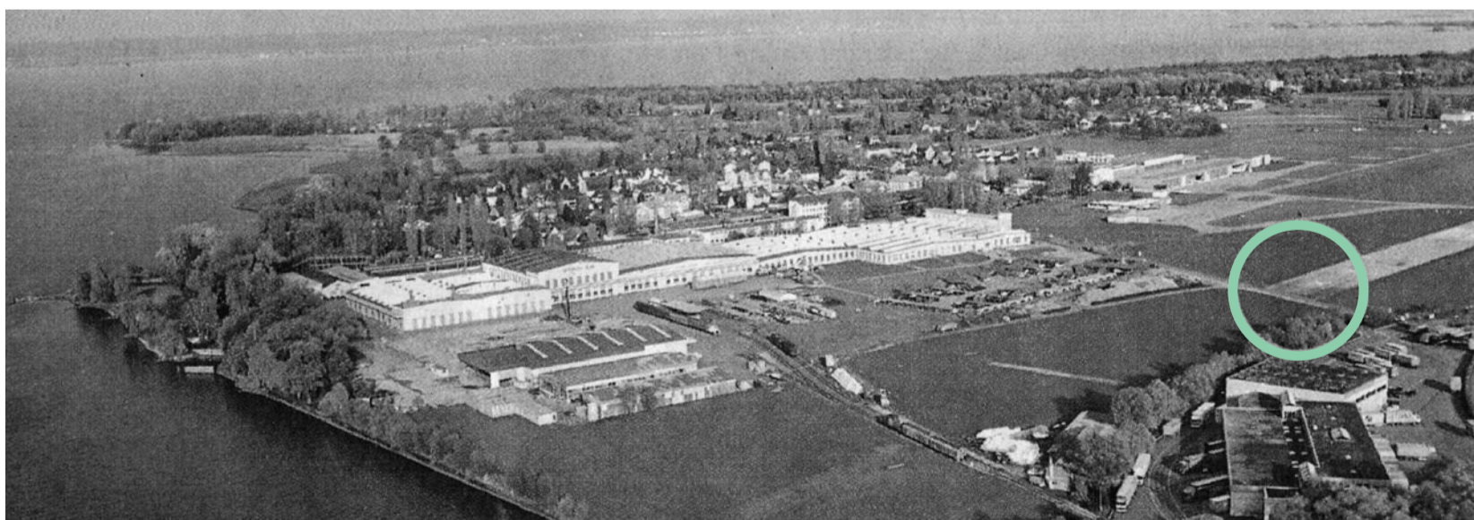
Die Dorfstrasse würde die Anflugbefeuerung, welche die Verlängerung der Landepiste markierte, kreuzen. Darum wäre eine Ampel nötig (Kreis). (OT 23.12.99)

Der Ausbau des Flugplatzes steht konträr zu den Meinungen, welche die Bevölkerung der Gemeinde Thal in der Umfrage zu den Flughafenfragen äusserten. Die AgF möchte den Gemeinderat von Thal an sein Versprechen erinnern, dem Resultat der Umfrage Rechnung zu tragen und sich gegen das geplante Vorhaben zu stellen. Die Bewilligung einer Anflugbefeuerung ist ein Schritt in Richtung Konzessionierung, welche der Gemeinderat laut öffentlicher Stellungnahme vom 11. Mai 2001 «nicht unterstützen würde». ■